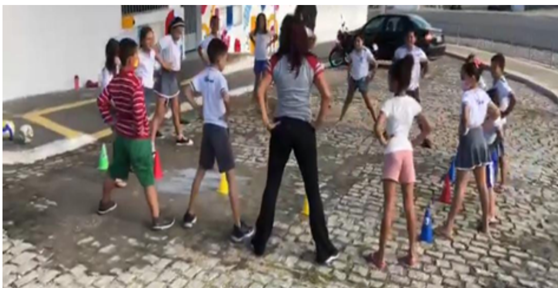
Figura 4 – Orientação da atividade.

CRÉDITO DA IMAGEM: Professora regente da sala, 2023.