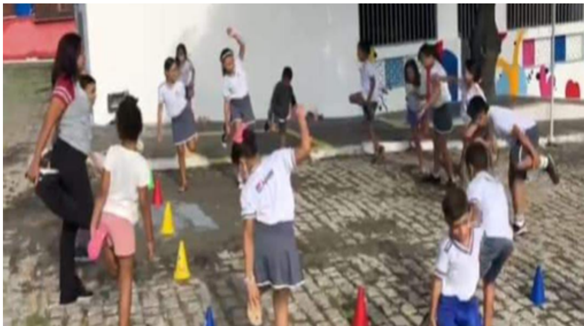
Figura 2 – Regras de relações e cooperação.