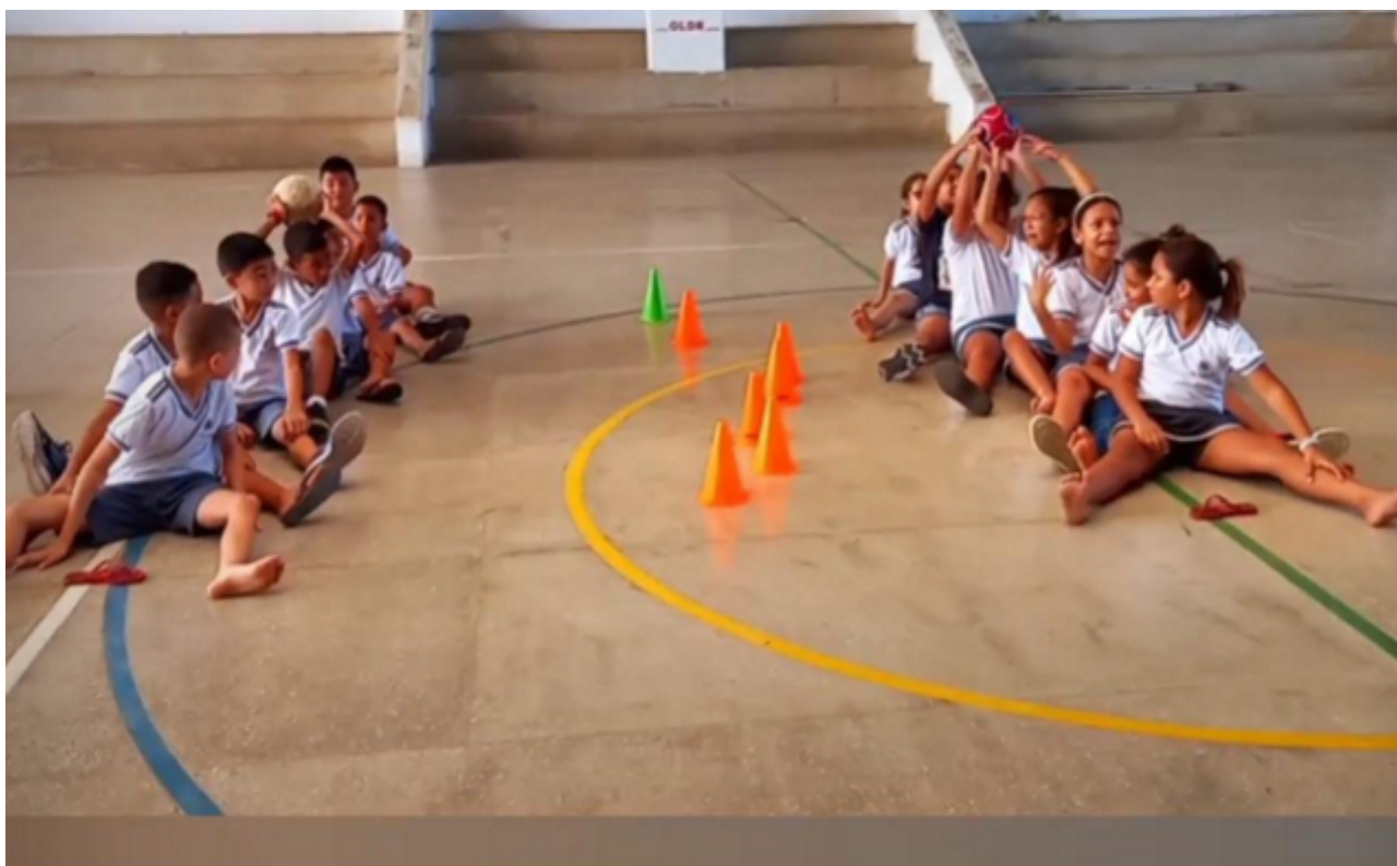
Figura 1 – Ações psicomotoras que desenvolvem os aspectos motor, cognitivo e afetivo.